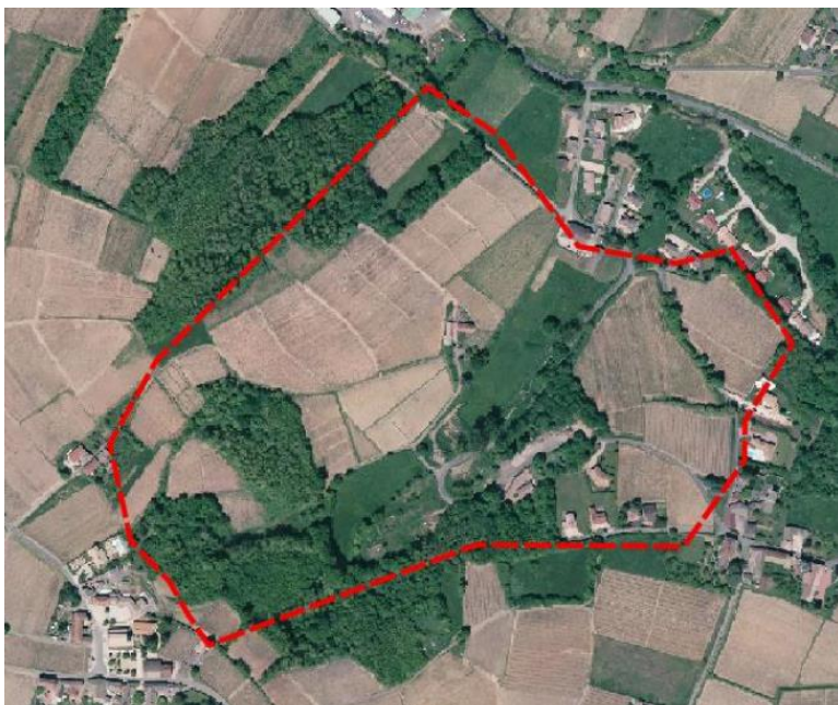
Zone de traitement