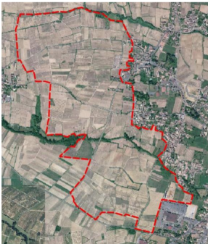
Zone de traitement