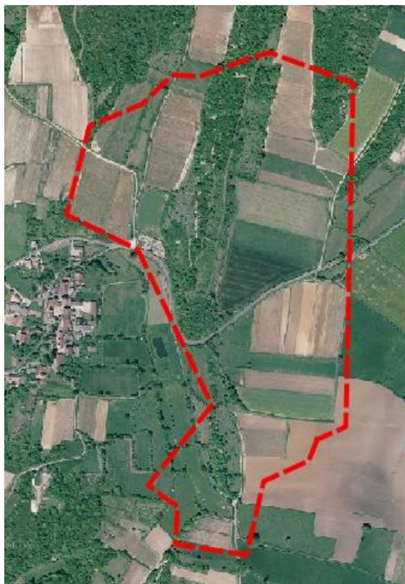
Zone de traitement