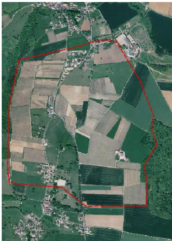
Zone de traitement