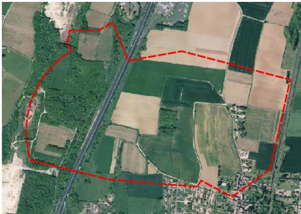
Zone de traitement