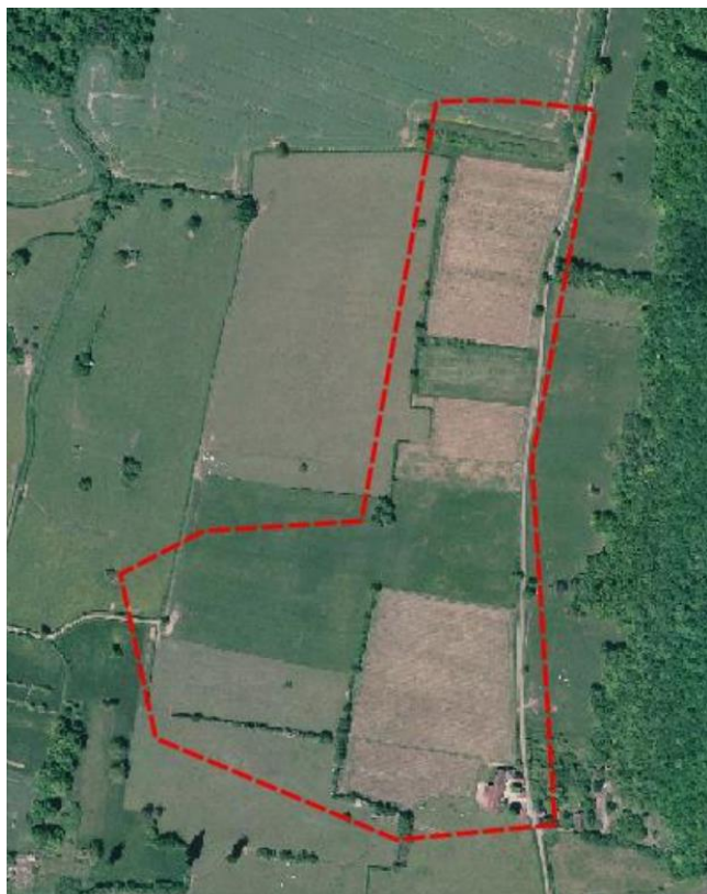
Zone de traitement