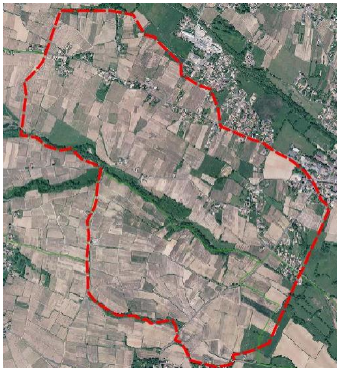
Zone de traitement