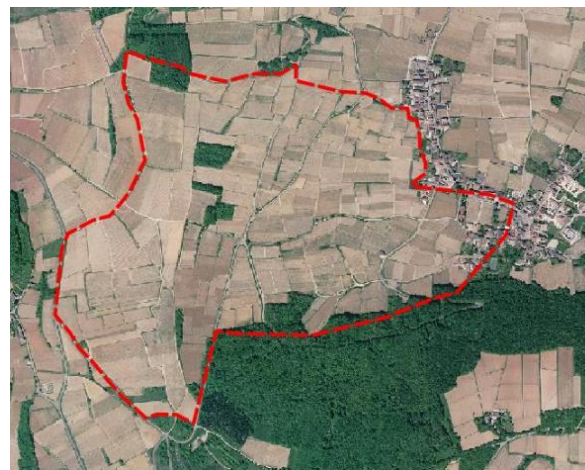
Zone de traitement