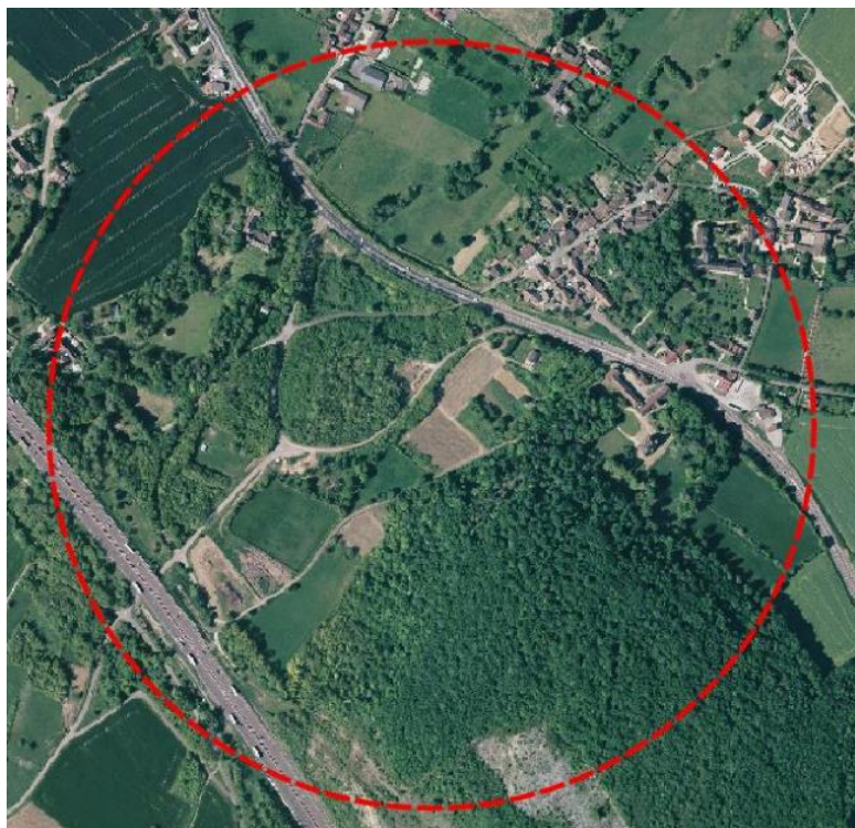
Zone de traitement